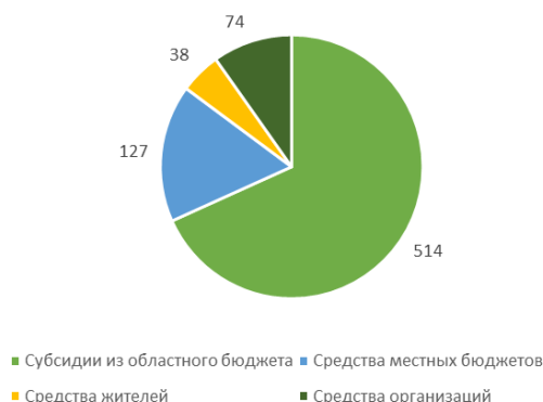
Рис. 2. Структура средств, предназначенных для инициативных проектов муниципальных образований Саратовской области